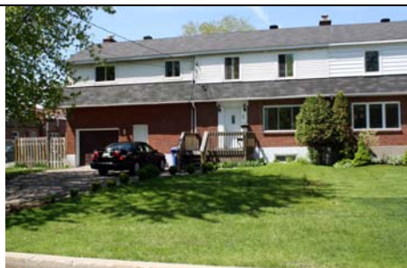
1 Valois Circle